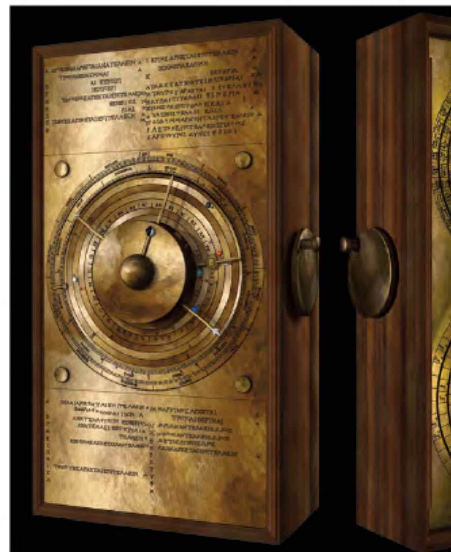
Graphic by Tony French

1900年、ギリシャのアンティキテラ島の近海で紀元前1世紀の難破船から石灰化した塊が発見され、精巧な歯車が顔をのぞかせた。「アンティキテラの機械」と呼ばれる。その後の研究で、日食や月食などの天文現象が起こる日付を予測する機械式計算機であることが判明し、近年になって歯車機構の詳細が明らかになった。複数の歯車をピン・スロット機構でつないで微妙に調整する仕組みや遊星歯車が活用されている。こうした高度な工夫はずっと後の時代になって発明されたと考えられてきたが、古代ギリシャの知恵はそうした見方をはるかに超えるものだった。