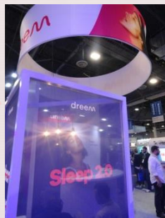
今年1月にラスベガスで開催された 「CES 2019」のスリープテック関連展示